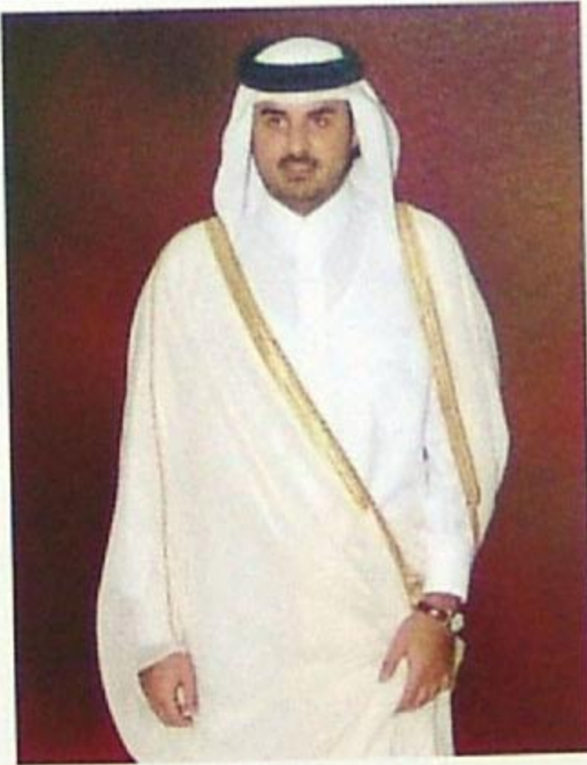
سمو الشيخ تميم بن حمد آل ثاني ولي العهد الأمين